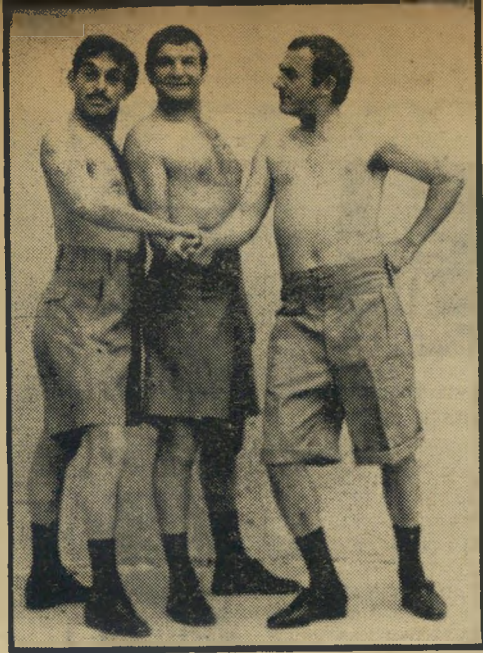
שייקה באלבום שוטרים בראבו, שוטרו

במאומה מאותם המופיעים בקטלוגים הי- מסויימים.