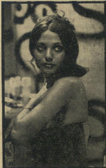
זמרת דלידה זהו, יפוי