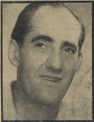
מנהג בנייהורה "לא הבטחנו —"

אנחנו לא מבטיחים שום דבר בבית הספר הזה. באים לכאן חובבים שאנחנו מלמדים