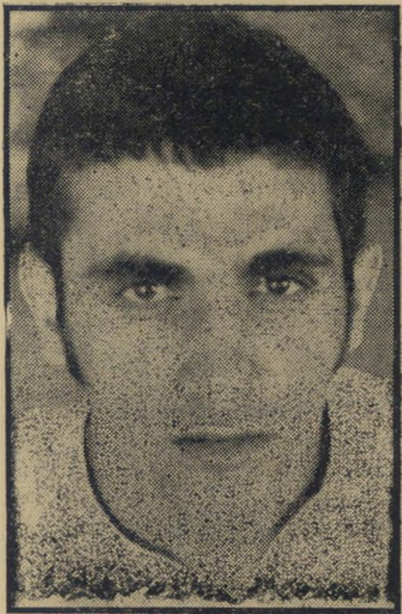
מתעניין מרציאנו "כן הבטיחו"

אותם הכל, במשך שלושה חודשים. מחיר הקורס 300 לירות. אנחנו לא מבטיחים עבודה. בתום הקורס אנחנו עושים סרט של שמונה דקות. ביום אחד. באותו יום, לומדים התלמידים את העבודה המעשית. כן מבטיחים, לא מבטיחים. חיי סרתיאום מסויים קיים גם בין בנייהורה למזכיר בית הספר, יעקב אודם, היודע ל-ספר לתלמידים פוטנציאלים כי בקריב