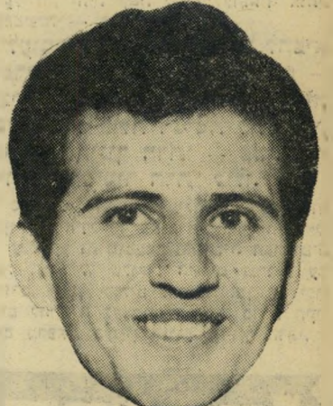
משורר אליקאסם מי עריק?

לו חיים נוחים: לשבת בקפה סמירמיס ולכי... תוב שירים ומאמרים, במקום להצטרף לבני... עמו - דהיינו לאחד האירגונים הפלסטינאים... התקפה חריפה. גם רדיו סוריה הצ'... טרף להתקפה זו, אבל בנושק אחר. ידיו... של דבויש, המשרר סמיה אל-קאסם, פיר... סם בגליון פברואר של אל-ג'זירה. ירחין... ספרותי של רקיה, מאמר התקפה חריף על... דרויש, בו אמר, בין היתר: