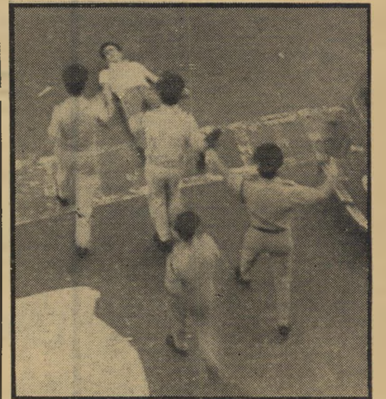
מפגין על הכביש לפני המערכת

אולם אני סבור היום, כפי שאמרת, כי יש להקים במדינה זו מניסטריון לנוער ול-