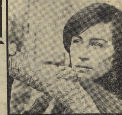
מלחינה הירש זה בא מהשמים

באמצע דיקלום. בראדם יכול להיות חרוץ כמוני כל החיים, ולא יקרה לו משהו