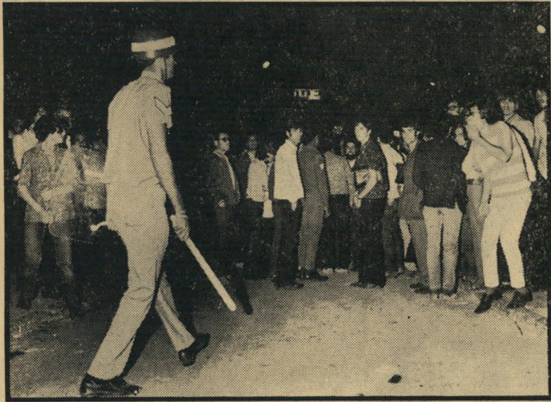
יש קיפוח עדתי בארץ, ויש בעיה סוציאלית ממארת. בשילוב השניים יחד — הקיפוח העדתי והפער הסוציאלי — אנו מייצרים פצצת-זמן. המתקת מתחת לרגלינו.

לא יתכן שחייל, שנתן שלוש שנים למולדתו ושמיכן את חייו יום יום, יחזור הביתה וימצא את עצמו במצב נחות, לעומת העולים הכאים היום. עם כל הצורך לתת זכויות לעולים (ואני בעדן), איי אפשר לסבול מצב שבו צעיר שנולד וגדל בארץ יקבל פחות מעולים חדשים. יש צורך לבדוק מחדש את בעיית חלוקת ההכנסה הלאומית. אם הבנתי נכון את דבריו של חברי-הכנסת יצחק בן-אהרן, כפי ששודרו היום ברדיו, מוטב שחברנו למפלגה יטו אוזן לדברים אלה. תופעת הקיפוח והפער היא כלל-לאומית, ולא על-ידי העמדת גישה עדתית אחת כנגד גישה עדתית אחרת, נפתור בעייה זו.