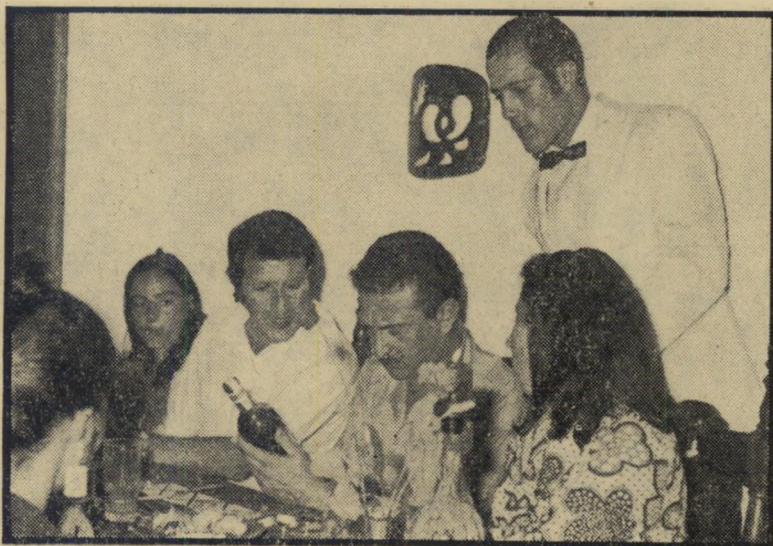
עזר וייצמן ב"הזוביו" רשיון — לאיזו מטרה?

לפני חצי שנה בדיוק, טגה יצרן ירר שלמי צעיר של מוצרים מיכאניים, מכתב