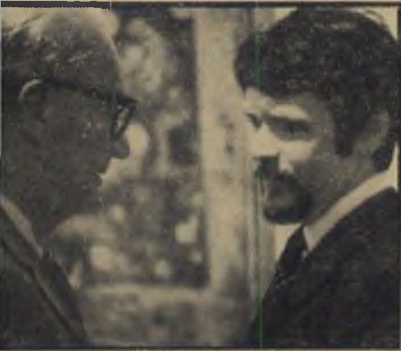
עם קרונקייט ואלטר קרונקייט, הפרשן הפוליטי המפורסם ביותר בטלחיויה האמריקאית, בישיבה עם יענקל בתערוכתו בווינגטון.

ציירים, סימן למעמד. אם מציגים צייר בגוגנהיים, סימן שהוא "עשיר".