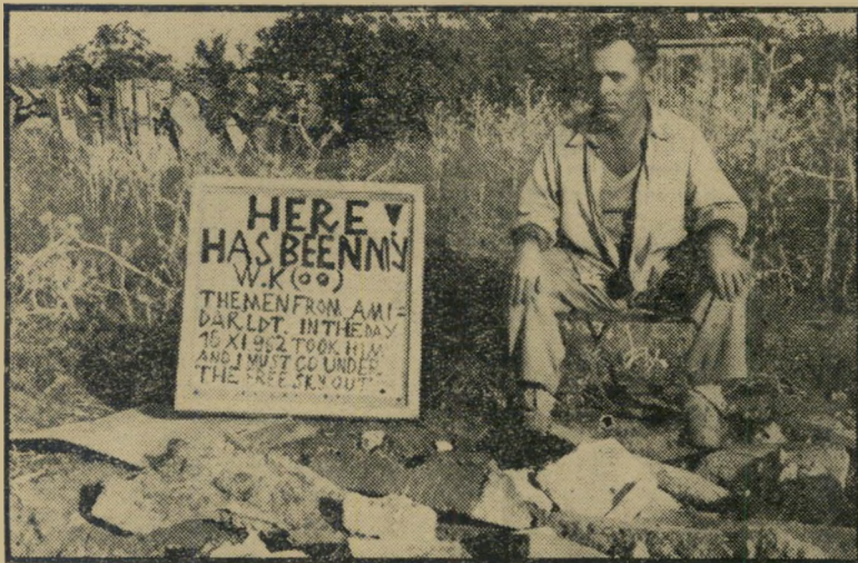
עגלון גרוס ליד שרידי האפסי-אפס שדו חוט-השדרה נשבר, רוח-הלחמה - לא

בדקירות סכין. יותר מזה, לא הצליחו לק-בוע. במשך יותר משלוש שנים, נשאר הרצח המיסטורי לא פתור, כשהרוצחים מסתובבים חופשי. רק בימים אלה הביאה המשטרה לדון שני חשודים - את שני בני-הדודים מוסטפה ואיסמעיל סרסור, תו-שבי כפר קאסם.