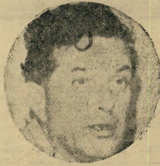
פרופסור לקייר בקאהיר — 'התקווה'!

"אני מאמין, שמתחוללת תמורה מהר' חית במצריים. פקידים, דיפלומאטים ואח' רים — אינם שרים אמנם התקווה ברהו'