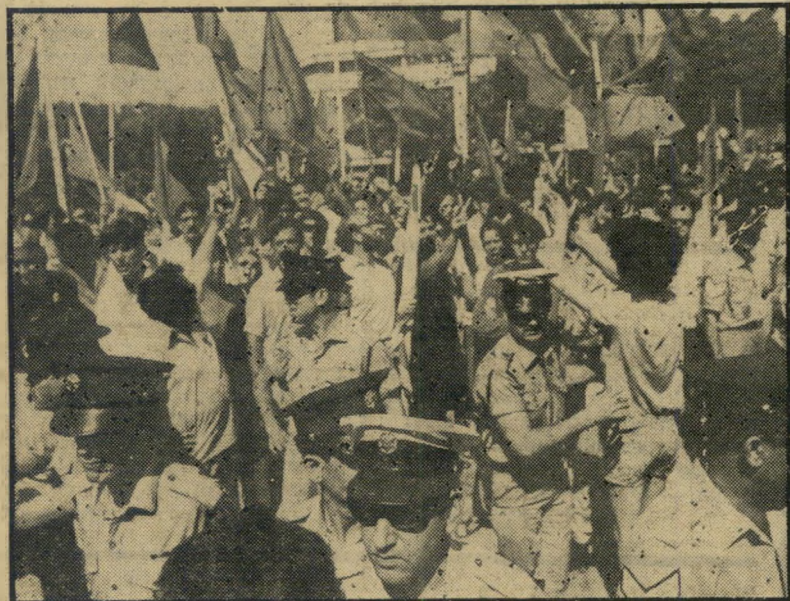
אנשי ש"ח נושאים דגלים אדומים למכים — מכותו

שושנה עברה לגור עם מוסטאפה בכפרו, שם היא שוהה מזה שנה. אולם הפרשה התפוצצה רק השבוע, אחרי שאבי הנערה, שלא ידע כל הזמן את מקום הימצאה, הגיע לארץ, גילה באמצעות המשטרה כי בתו מתגוררת עם אחוב-ליבה הערבי ב-