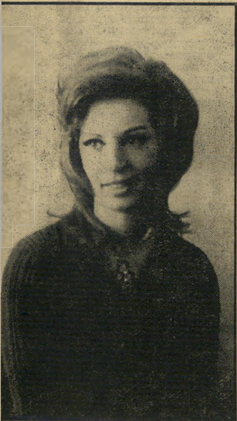
קריינית מסוואדי בית-הספר נקרא "ציון"

רבים מצופי הטלוויזיה העבריים, נוהגים להתבונן גם בשידורים בערבית. בין שאר הסיבות, יש להם סיבה טובה לכך: השעה היומית בערבית מגישה לצופים יותר חתיכות מאשר השידור העברי. לעומת המגישה היחידה בתוכנית העברית, דליה מזור, שהיא חייכנית אך חסרת הבעה, היו עד כה למחלקה הערבית שתי