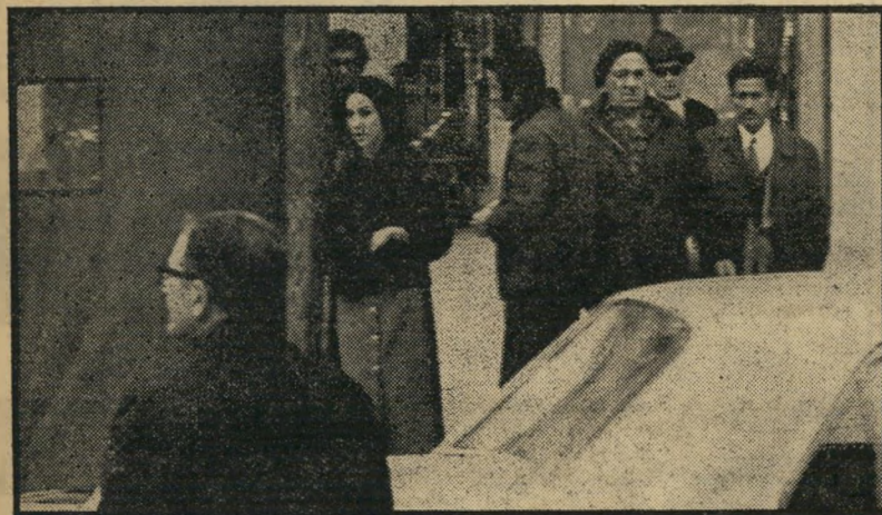
רי. שום דבר לא עוזר. הצעיר במעילה-רוח (ימני, בתמונה מימין) נראה הולך לדרוכו, אך בתמונה משמאל הוא כבר לא הולך. ניגש אל מיכל ומנסה לפנות אליה בדברים.