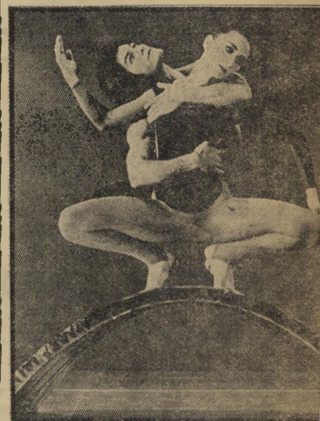
שינפדר ורון ב"תמורה" יש תמורה לכספי הבראונית

פוליטיקה היא קאריירה . ברם, תוך כדי מישחק מתגלים דברים נוספים על פרופסור קירמן, למשל, שהחלטותיו לא היו אלא חלק פעוט מן הגורמים שבאמת הכריעו בגורלו, שיתכן אפילו שהחלטותיהם של אחרים שהשפיעו יותר על חייו. שהפרופסור הנכבד, נציג אופייני מאיך-כמותו למשכיל המודרני המצוי, הוא איש אנוכי עד כדי אימה. שהוא מנותק לגמרי מהעולם, אותו נועד לחנך בתוקף תפקידו. מנותק עד כדי כך, שהוא חסר אפילו כל עמדה פוליטית שהיא. פוליטיקה, עבורו, הוא משהו שיכול, לכל היותר, להשפיע על