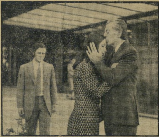
שילה ודרזי: הפרקליט והסוטה

בעצם, אולי לא הבינה הביקורת בארץ את הסרט. זאת אינה דרמה — זאת קומדיה. הכל נעשה כדי להצחיק, ולכן הבימוי הוא חובבני בכוונה, המישחק