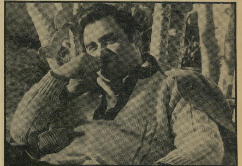
מפיק שוויילי סדינים לניגוב הדמעות

עשיתי עד עכשיו. זה מה שהקהל אוהב. ומה תגיד על כך הביקורת? אם אין להם מה לעשות, אני מוכן להעסיק אותם כניצ-בים אצלי. אולי בזה יהיו טובים יותר."