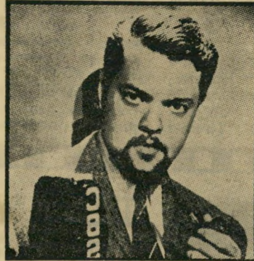
אורסון ולס בתפקיד קיין (1941) מסית לאומני

האקדמיה לאמנות הקולנוע, הממונה על חלוקת פרסי האוסקר בהוליווד, לא הצטיינה תמיד בטעם משובח, או בשיקולים אמנותיים שהורים. לא פעם חילקה את פרסיה כדי לפצות מישהו על קיפוח קודם (זה קרה לחיליאם הולדן בסטלג 17, או כדי להביע את אהדתה לאישיות פופולרית בצרה (אלויבס טיילור, שתלתה לפני גלוריה). לעומת זאת, היא לא מצאה לנכון להעניק פרס לצ'ארלי צ'אפלין, בשנים שיצר רבים מן היסודות של כל אמנות הקולנוע, ו-