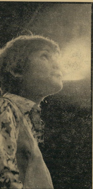
גליה ישי ב"ב, במיקצב ה-70" פנפ לצעירים

★ ★ ★ הקנין שחלק (אורלי): אר- בעה צעירים מתבגרים בחופש-תיקין, ומס- תבר שלהיות צעיר, זאת לא אמרת להיות טוב טהור וכן. סרט שמצטיין בתיאור אחירה ורגשות (פנקר ואליונור פרי). ★ ★ ★ ג'ון ומרי (ירושלים, אר- צות-הברית): דאסטין הופמן ומיא פארו בקומדיה רומנטית על שני יצורים בודדים והמיכשולים העומדים בדרכם אל האושר.