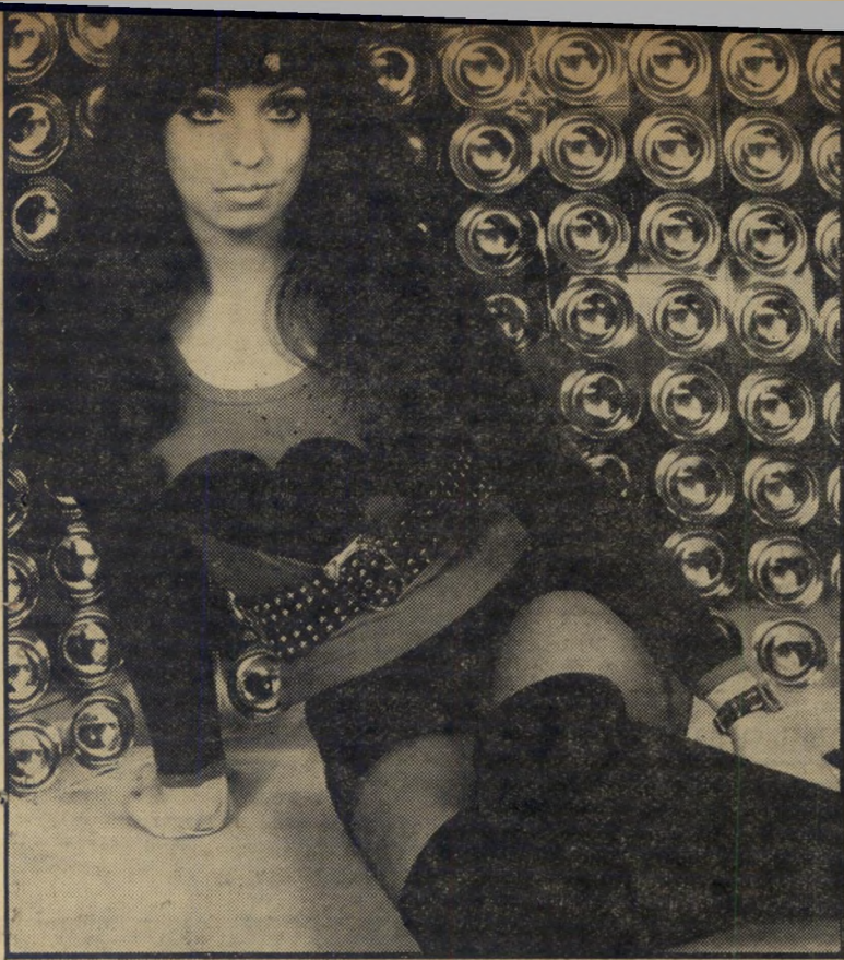
מריסקה מרס מה "כחול מזעזע" הננוס של ונוס