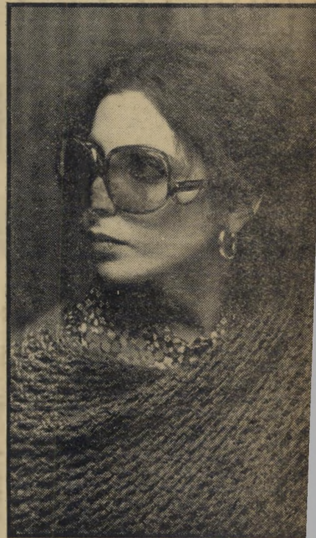
זמרת אתי עופרים העיקר הבריאות

את היומיים הראשונים לשיבת ציון (ה' זמנית) של אסתר עופרים, בילתה הזמרת