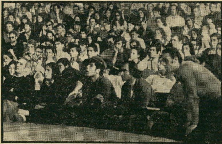
פנתרים וסטודנטים מקשיבים

יוקו מצדה, לא גילתה גם היא אהבה יתרה לנשים אחרות — או לבעליהן. כשם שלינדה יצרה קרע כאשר הסיחה את פול למנות את אביה למנהל הלהקה בניגוד לרצון האחרים, הייתה עתה יוקו את ג'והן לצרף אותה ללהקה כחיפושית חמישית. היה זה המספר האחרון בארון-המתים של הלהקה, והפירווד הפך לעבודה. כמו שכתחילת דרכה המפורטת בנו הנשים את החיפושיות — כן עתה, בסופה הרסו ה"נשים את האגדה המציאותית הנפלאה.