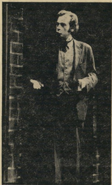
מגן כציוני בן, מעבר לגבולין

●●● פפטיבל הזמר של יום ה-עצמאות הקרוב יעלה מתדרירבטן, שכן כבר ידוע וגלוי ששתיים מתוך הזמרות ש-