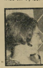
גיודי עצמה היא הסידרה

הסערה הציבורית, שהתעוררה בשבועות האחרונים סביב שערורית האישפוז במדינה, בעיקבות פירסומי העיתונות על כך, הגיעה את גיודי לוך, במאית ומפיקת הסידרה ישראל 80, להקדיש סרט תעודתי של 30 דקות במיסגרת הסידרה, למצוקת האישפוז.