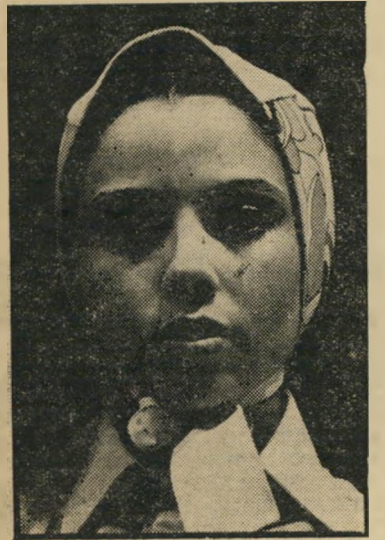
תגלית שאוף בובה ליהודים

חדת ומצלמתו נמשכה אליה שוב ושוב. כל מי שנכח בחזרות על מופע, "גיאמי בוי", שבכורתו ב"תיאטרון העממי" של פשנל-דשא באולם, "דקל" (אז, כמו ש-אומרים - "הדשא הצמיח דקל"), בטוח שזוהי תגלית הערב. אפרים קישון, הבמאי שלה בשעות