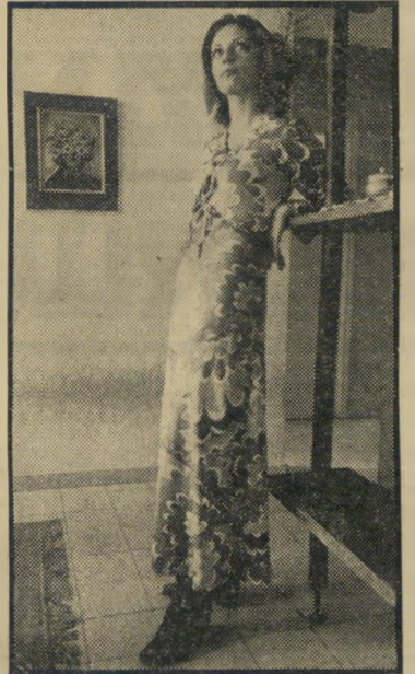
דוגמנית אידלמן בחיים אבל הפרצוף חשוב יותר

תיות בהריון אמיתי. גם זה לא היה זה. הוא סרק את אלבומיהם של צלמים רבים, מבלי למצוא את מבוקשו. עד שנתקל ב- תצלומה של הבלונדית היפהפייה אצל הצלם גברא מנדיל - "אחריקה", קרא בהתלהבות. בקלסתר החייכני שניכחו, מצא את כל אותם מרכיבים שחיפש.