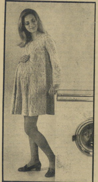
דוגמנית אידלמן במודעה הריון חשוב מאד

לפניו במודעה דוגמנית חייכנית שמנסה למכור לו משהו, אינו יודע אילו שיקולים מורכבים כרוכים בהתאמתה של דוגמנית מסוימת למוצר מסוים. הפירסומאי ניסה תחילה את מזלו עם דוגמנית אמיתית בהריון אמיתי, לא היה שבע רצון מה- תוצאה. אחר ניסה כמה עקרות-בית אמר-