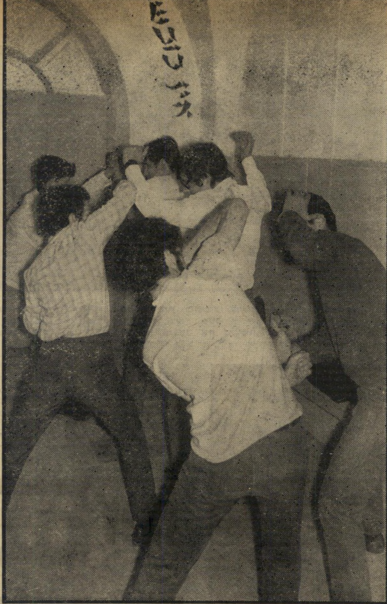
אנשי ה"ליגה" מתאמנים לקרבות-רחוב במועדון בית"ר

השכל הישר. כך אישרה הוועידה דבר שהוכח זה מכבר על-ידי מישאלי דעת-הקהל: