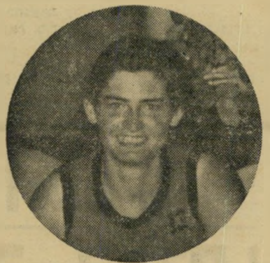
כדורסלנית רוטנברג לניתוח — סעי לחיפה

חולפת חצי שעה עד שהפצוע נרשם ב' ספר הקבלה. כל אותו זמן הוא שוכב ללא טיפול. בעשר ורבע, הוא זוכה לבידוק ראשונית, נשלח לצילום רנטגן. שם חל עיכוב נוסף. בגלל שביתת האטה של טכ' נאי הרנטגן, עובד שם רק אדם אחד. דורה מוחזר מהצילום האורך דקות ספור' רות, לחדר עזרה ראשונה, בשעה 23.15. שעתים וחצי חלפו מאז שהובא לכאן ופניו מלאות בוך ודם. הוא ממשיך עדיין ל'