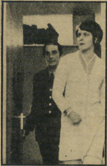
עדה מקוטבת מוניקה „הציל את חיי בשיטתי” —

העידה אשתו של הרופא, ליולוט בת ה-40: „אנחנו נשואים מזה עשר שנים. אני אשתו השלישית. מעולם לא הסתיר בפני את צורת הטיפול שלו. לא, נישואיו לא סבלו כלל משיטתו. מעולם לא ראיתי ב-מעשיו בגידה בני. אורכה — בתחום המיני הוא מאהב יוצא מהכלל. באהבה הוא משי-