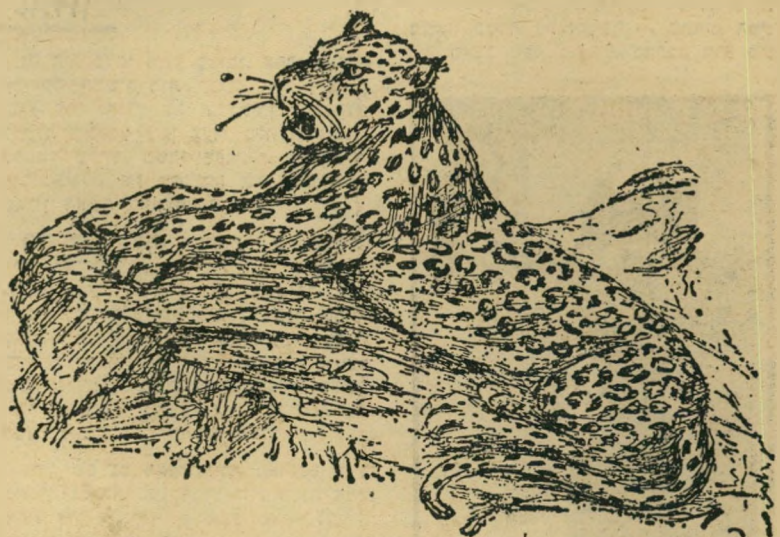
פאנתר באפריקה *

הקבוצה הירושלמית אינה דומה ל... פנתרים השחורים באמריקה, שהיתה מראשית תנועה פוליטית ואידיאולוגית. אבל יש ב-