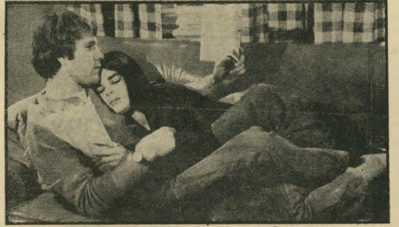
איזייל ומקינראו ב"סיפור אהבה" עתיד — בחילה

(הבמאי) העמיק לחדור לנשמות הנבוכות בענייני מין, אהבה וידידות לפי רוחו של לורנס (הסופר). *** יחפים בניו-יורק (תן, ארצות הברית): קומדיה על חשבון תלאותיהם הי מעציבות של זוג פרובינציאלי (סנדי דניס וג'ק לימון), שבא לגיוויורק, למצוא חיים מתוקים ומוצא ביריונים, רמאים וקצבי חיים צחנני. תסריט מלוח של גיל סימון. *** מזך ליום אחד (תכלת, צרפת): סרט יוצא-דופן של פיליפ דה-ברוקה, על טירופם של האנשים המקובלים בחברה