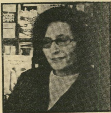
מו"סית קושנר, שיא של מכירה

היו אלו רק דוגמאות מעטות מהים הר כללי, המכניס רווחים לכיסי המוכרים והמו"לים, וממלא את בתי הישראלים ב חומר שהוא לעיתים הדרכה מינית ממדרגה