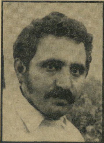
קורבן השתדודות וקנין — הכנופיות שולטות ברחוב

מה היתה הסיבה האמיתית להתפרצות הברברית של קבוצת הבריונים בשדרות, שבמסע לילי עליו ניפצו את הלונות-הראוה בכל המרכז המסחרי בעיירה, גרמו נזקים של רבבות ל"ה, תקפו שוטרים, וגרמו לזעזוע שחרג הרבה מעבר לגבולות העיירה — זעזוע של כל בן-תרבות נוכח ואנדאליות חסרת-טעם? הסיפור, כאילו היו החמישה שיכורים, היה נכון רק בחלקו. לא האלכוהול הוא