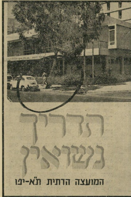
חוברת הרבנות לפני

לאחר שבעלה עזרה עזב אותה, זכתה זינט קוצרו (24) למונוט בסיך 125 ל"י לחודש. אלא שלאחר תקופת מה בה שי-לם, נעלם עזרה. זינט פנתה לבית-המשפט, קיבלה פקודת-מעצר לביצוע בית, המחייבת כל שוטרי לעצור את בעלה ברגע שיאותר. ב-10 לינואר פנה עורך-הדין ישעיהו לויט,