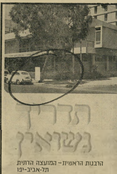
חוברת הרבנות אחרי