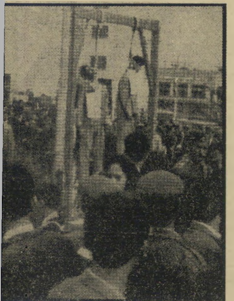
התליות בכנאדא — לפני שנתיים

אבל המיטטר הסורי היה מאו ומתמיד יוצא דופן בחוסר יציבותו, במעשי הטרורף שלו, בדחפים הפנימיים הרוחפים אותו לא רק לפגוע באחרים, אלא גם להרוס את עצמו מבפנים; מיטטר שסיבך לא רק את ארצו ואת ישראל בתקריות גבול ובמעשי טרור ותגמול, אלא דחף את העולם הי-