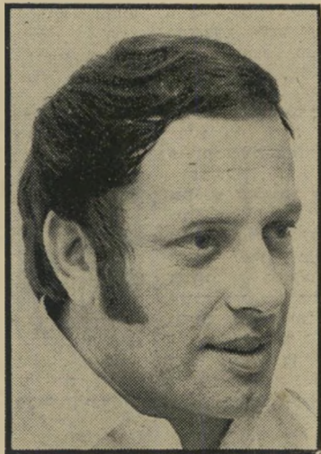
מועמד צוקרמן ממי עושים צחוק?

חזקה כלפי העובדים. יתחילו לטפל במפירי משמעת כרוניים. בית'הדין המשמעת, שי הוקם ברשות'השדור לפני כמה חודשים, יופעל כנראה הלכה למעשה. בחוגי רשות'