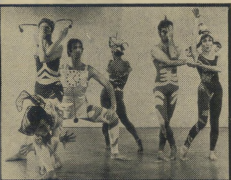
רקדני "בתידור" רוקדים לפי ציור של קליי

● ושעיה השלישית (יום ב, 1/2, 20.20) צידי הנאצים — סרט דוקומנטרי.