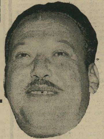
ח"כ קרמרמן שותף שקט

Organization of Petroleum Exporting Countries.