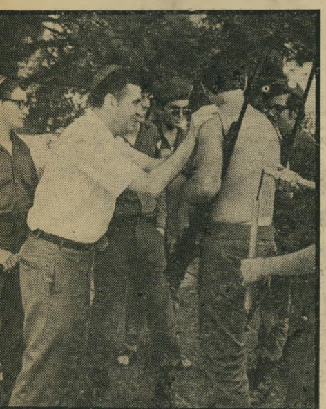
הרב כהנא עם אנשיו

אדרבא, שיתאמנו בנשק, שיגנו על יהו-דים מפני פורענות — אם תבוא. שילחמו בגיוענות ובשינאה. אל להם להכתיים את המאבק הגדול שלנו. ובמישור האישי: אם הם מוכנים ללכת לקיצוניות כזו כדי להב-טיח את עלייתם של יהודי רוסיה לישראל — שיעשו הם עצמם את הדבר הפשוט: שיארו את חפציהם ויעלו לישראל.