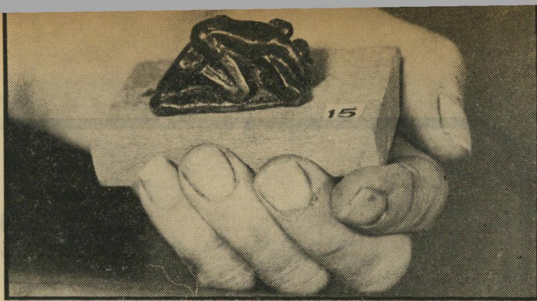
פסל מיניאטורי בתוך כף יד

ואחרים מתנגדים לאורי אבנרי ושלום כהן בצורה עיוורת ובזים לאלה התומכים ב- הם. ובכן, לא כך הוא. פעמים רבות הודהיתי עם דעותיו של אורי אבנרי, אך אני מתנגד לאלה הרואים בו ובשלום כהן אלילים