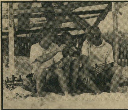
תומס, הרשי ודווידסון על שפת הים

בתפקיד הראשי, או במוסיקה הסרקסטית של אנו מורי-קונה (מלחין "הטוב, הרע והמכוער"). אבל זהו סרט ה-עשוי חטיבה אחת, וכל הפרטים משרתים היטב את המט-רה העיקרית: הצופה, העוקב בדריכות אחרי הנעשה על הבד, לא יוכל בסוף ההצגה שלא להתבונן בחשד בכל היושבים סביבו. אפילו שיש אצלנו דמוקרטיה.