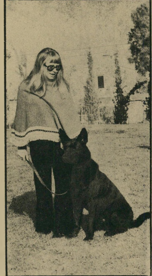
זוכה רינג'ו בפעודה הילדים לא הבינו