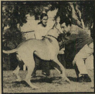
— וחברו תוקף — אך לא לחוספי ארנקים

מזוקקים כולם. לעומת הצגות ה' כלבים, נעדרה הפעם מהתערוכה ההצגה ה' אנושית הקבועה — תצוגת-האופנה של בעלות הכלבים. הגברות, שהגיעו עם כלבי הן, בעליהן ומכונותיהן מכל רחבי ה' ארץ, החליטו כנראה שבאר-שבע איננה