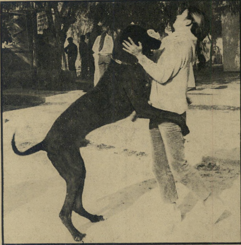
"דני-ענק" מחבק * — יחס אנושי

הגבר שהסתער על הילדה שעדה ל' תומה על הרשא, חשב שחטיפת הארנק מ'