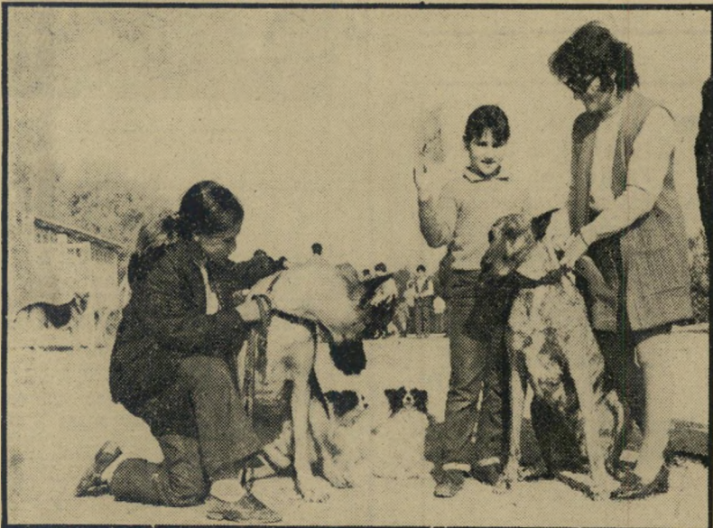
זוג "דנים" ענקיים זוג, "פאפילונים" גמדים ממשתתפי התחרות הפעם — ללא תצוגת אופנה