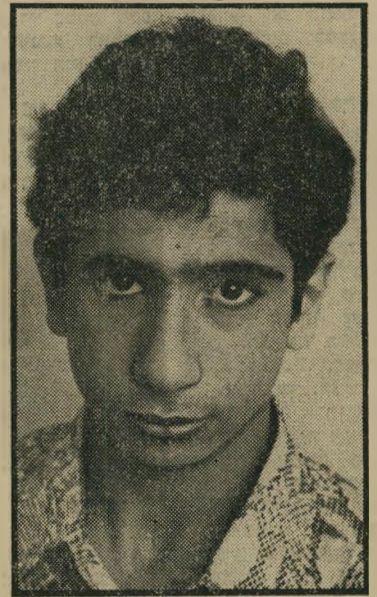
נזקק סעד כדורי טיפול מיוחד