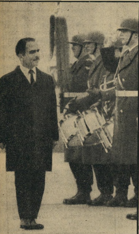
המלך חוסיין בבון

מאחר שגם בעבר ניצל חוסיין את ביקוריו באירופה לשם פגישות עם מנהיגים ישראליים, סביר להניח שדיין ניצל את חופשתו כדי לקפוץ לאירופה ולפגוש שם את חוסיין. הוא עשה זאת, כך כנו לעצמם הכתבים הזרים את הסיפור, בחברתו של יגאל אלון,