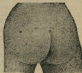
החלק האחורי של המנכיל