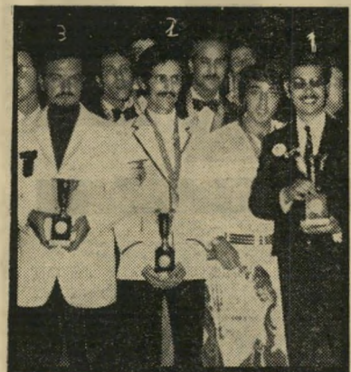
ספרים דיפלומטים כפרים* הזמנה לטוניס

לתדהמת הנוכחים הצטרפו הנציגים ה- ערביים לריקוד ההורה. הישראלים הורי- דו את כובעי הטמבל שלראשיהם ונתנו אותם לנציגים הערבים לפי בקשתם. לבסוף ניגש אחד הספרים הערביים מטוניס ש- נשאר בלי כובע טמבל אל ראש המשלחת הישראלית והתלונן בפניו על שאין לו כו- בע. אלן היה אובד עצות. הוא ניגש לאחד הספרים הצרפתיים הסביר לו שהכובע נחזק