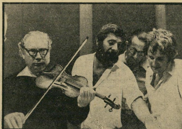
משתתף עתה בהסרת, "כנר על הגג" ביוגוסלביה. בין שאר ההכנות לקראת ה' סרט התאמן טופול עם הכנר איזאק שטרן (לידו) בנגינה.

אורי גלר נמצא ב' סכנה. מסתבר שהוא לא היחיד שחזה מראש את מותו הקרוב של נשיא מצרים, גמאל עבד-אל-נאצר. החוש ה' שביעי, הטלפאטי, גילה את מותו של נאצר גם לקדיש לזך, יושב-ראש הכנסת ל' שעבר. ביום בו נפטר נאצר