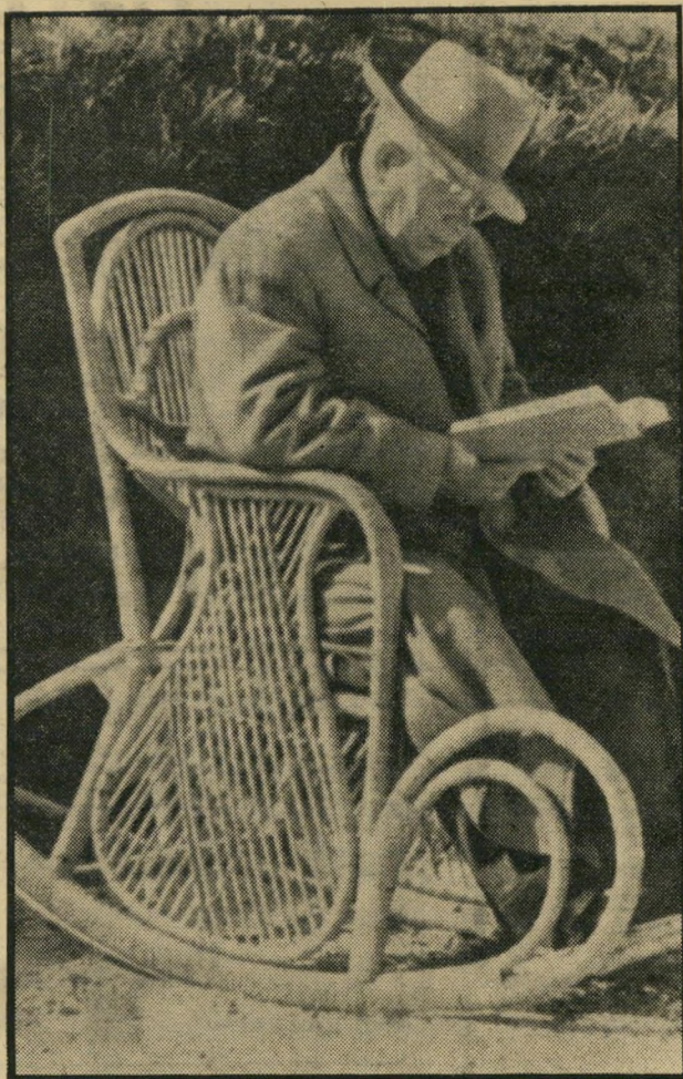
ניקיסה כרושצ'וב (76), שליטה לשעבר של בריית-המועצות, מתגורר עתה ב"דאצ'ה" נידחת במרחק 15 קילומטר ממוסקבה, כמעט שאינו מופיע בציבור, נקלע לתסבוכת רצינית עקב פרסום זכרונותיו.

גם על המיקרופון ש' הוטמן, בתקופה שאיסר הראל היה ממונה על שירותי ה' ביטחון, בחדרו של מנהיג מפ"ם מאיר יערי, היה לאיסר מה להגיד: "מדוע הם באים היום בטענות על אותה תקופה", שאל איסר בהתכוונו לראשי מפ"ם. "מעט נוער הם הפסי' דו אז לקומניזם? אנשים ש' מצאו מאז את דרכם למצפן ולמקומות אחרים... אפשר היה