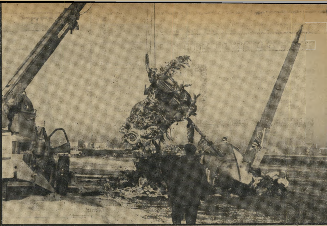
ציוד מיכני כבד מסלק את שברי שני המטוסים כתוצאה מהתאונה היה שדה-התעופה משותף במשך 9 שעות.

פרס חייב להסיק את המסקנה היחידה המתבקשת ממדליו: להודות בכשלונו ו-להתפטר מתפקיד שר-התחבורה. ללכת ה-ביתה ולפנות את התפקיד לאדם אחראי יותר, רציני יותר.