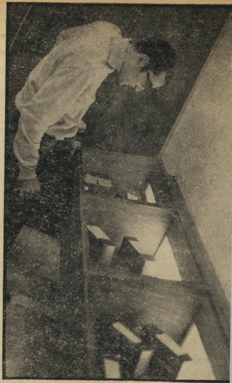
לקוח מתכונן במוצני "ארום" "דבר כזה צריך להיות"