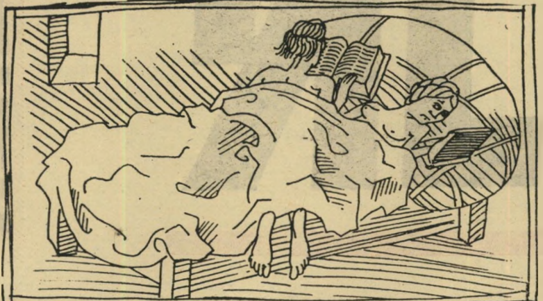
אחת אחרת מסוגלת לחקות אותם ול-העמיד את שלה במקומם.

ההתאמה בין בני הזוג - חשובה במיוחד תמיד דווקא במיטה, מישוגל נעים יכול להתרחש ללא כל הכנות. על השטיח, על המרפסת, מתוך ישיבה על כורסה נוחה. המקום לא חשוב. העיקר - מישוגל שכן דבר אחר, כאמור, ברור, ללא ספק, אל-דרכי שפרברי בית. חיים עתירי מין - הם ערובה אתה מספר לי, רבי?