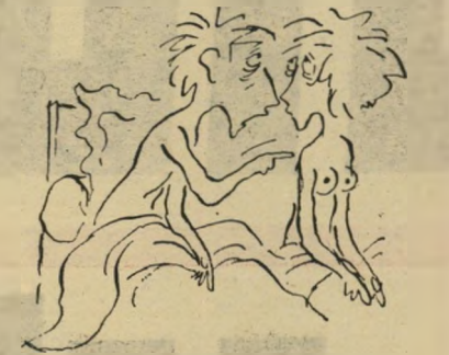
חיים עתירי מין - ערובה לחיי נישואין בריאים

א יעזור לכם שום דבר - השבוע אני מכניסה לכם ביקורת ספרותית. אבל איזה ספרות - שפתים ייסקו, אם תסלחו לי על הביטוי.