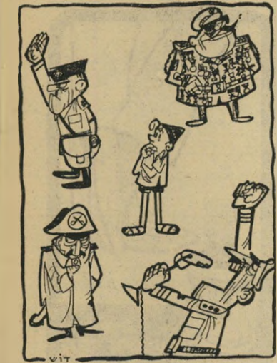
קאריקטורה של דוש

לצערי אין לי מקום ליותר מדוגמה אחת, אך חוקרי הגזענות ודאי לא יתקשו למצוא דוגמאות נוספות, בכתביו האינסופיים של מר גרוש.