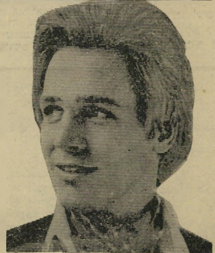
495 • פיסום או. קי.

... והדרך הנכונה לעשות זאת היא, כמובן, בויטל שמפו של נקה. ויטל שמפו מייפה את השיער ועושה אותו קל לסירוק ולסידור. גם לאחר יום מלא פעילות יראה השיער נקי ומסודר. ויטל שמפו מייטיב לנקות את הראש ומעלים את הקשקשים. למעשה חפיפה בויטל שמפו פותרת את בעיות ההופעה. התבונן במראה ותבחין בהבדל כבר לאחר החפיפה הראשונה. נסה.