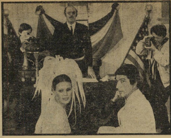
קונבי וקר מתחתנים (כמעט)

רוניק ואנדל: "אינני מתביישת להצטלם עירומה. חוץ מזה, אלה התפקידים היחידים שמציעים לי."