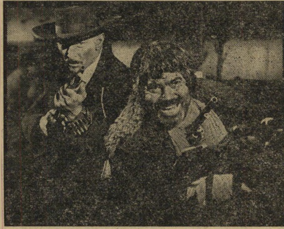
לי ואן קליף (משמאל) בפעולה

העולם כולו על מגש עם ארוחת-בוקר? מי שמוכן ומסוגל להפליג על כנפי הדמיון של דה-ברוקה והוא מספיק מנותק מן המציאות המודרנית, יינה, בעיקר מן ההתחכמויות הקטנות (הקצין בדימוס המתעמל בבוקר, בני הכפר המסבירים למורה שהוא חייב להתחתן) שהן חשבות יותר מן הסיפור המרכזי.